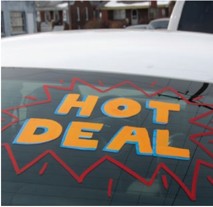
Mark. Marks on glass, and is rain and fade resistant.