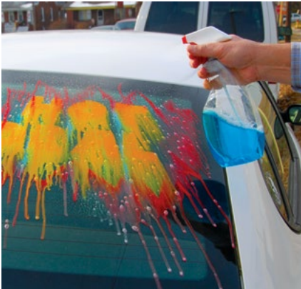
Spray. Removes easily with glass cleaner.