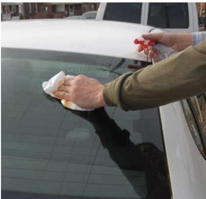
Clean. Cleans with a paper towel, leaves no ghosting.