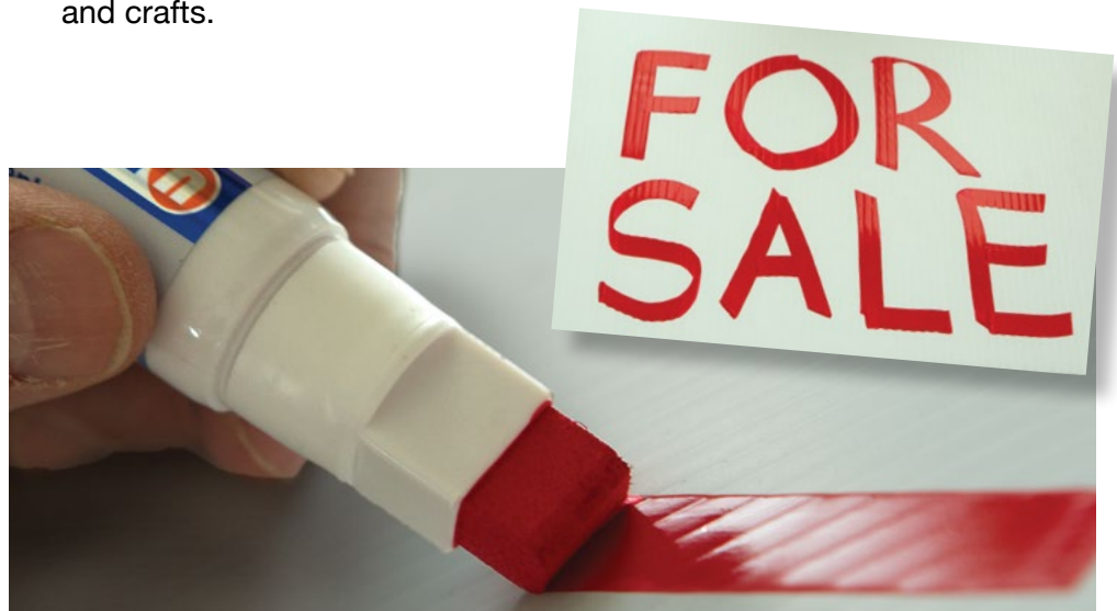
Perfect for signs, posters, banners and canvas.